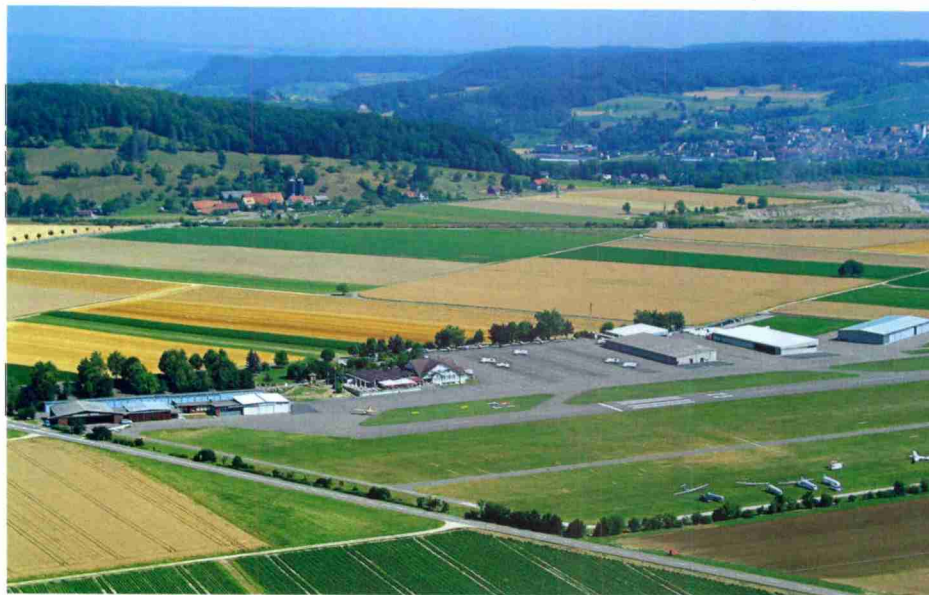
Regionalflugplätzen wie dem aargauischen Birrfeld (im Bild) fällt im Bereich der Erstausbildung von Piloten eine wichtige Rolle zu.