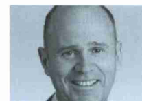
NR Thomas Hurter Zentralpräsident Aero-Club der Schweiz, Linienpilot und Inspektor der fliegerischen Berufseignungsabklärung Sphair

Die Beantwortung dieser Fragen führt zu einem Bereich der Luftfahrt, dem eine bedeutende Rolle im Luftfahrtsystem der Schweiz – insbesondere bei der Pilotenausbildung – zukommt: Die regionalen Flugplätze und Flugfelder sowie die darauf angesiedelte General Aviation . Gesamtschweizerisch bilden drei Landesflughäfen, elf Regionalflugplätze, 47 Flugfelder und 24 Heliports eine umfassende aviatische Infrastruktur. Sie