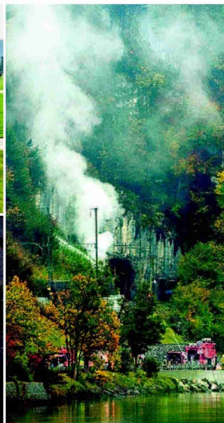
Der Absturz der Maschine des Typs F/A-18 (oben) verursachte mehrere Brände, die teilweise aus der Luft gelöscht wurden.