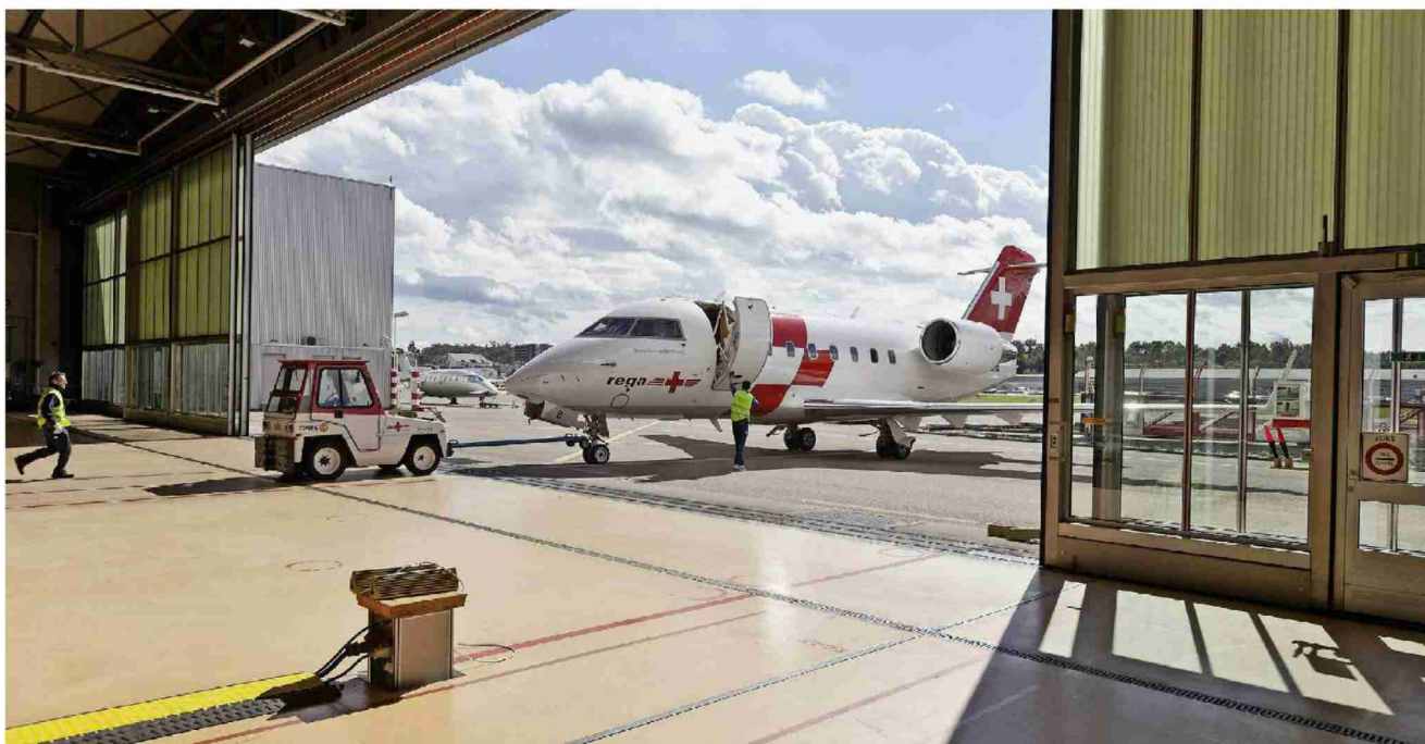
Das Schweizer Kreuz am Heck könnte bleiben: Ein Bombardier-Jet vor der Rega-Zentrale am Flughafen Zürich (September 2012).

Pläne des VBS «sehr überzeugend». Der Bund könne zu sehr günstigen Konditionen zwei gut erhaltene Jets kaufen. Sie erlaubten es der Schweiz, viele militärische Transporte künftig mit eigenen Flugzeugen durchzuführen. Zudem würden die Rega-Maschinen für die Bedürfnisse der Armee reichen. «Der Kauf eines grossen Transporters ist damit endgültig vom Tisch.»