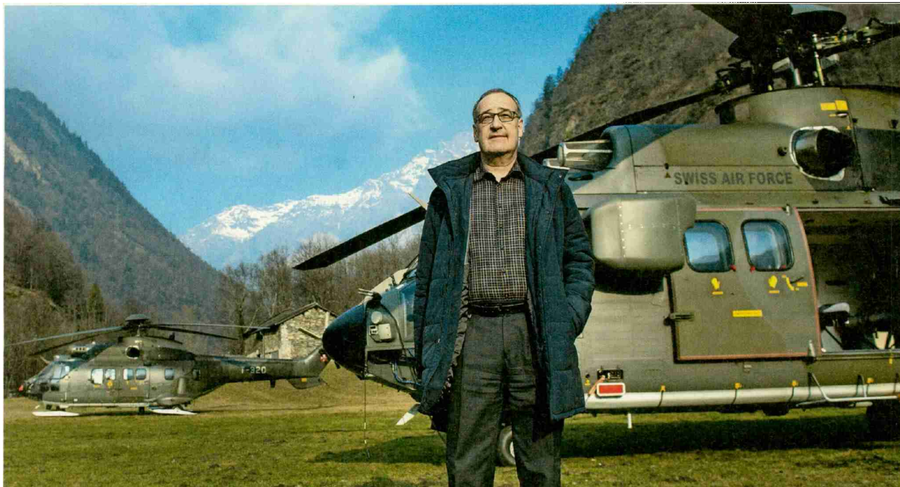
Braucht mehr Zeit: Bundesrat Parmelin in Soazza GR, Dezember 2016.

Referenz: 66097170 Ausschnitt Seite: 1/3