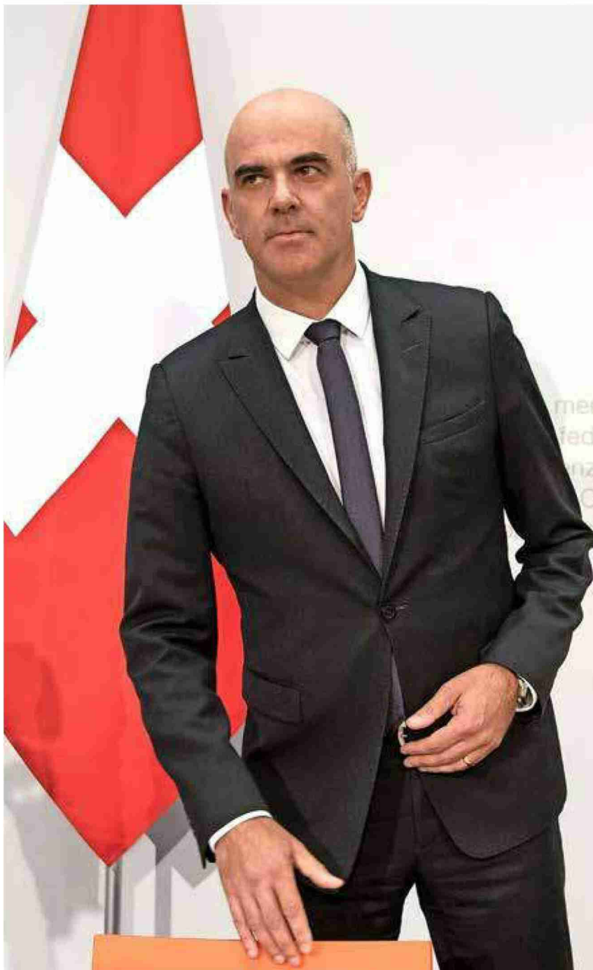
Bundesrat Berset will jetzt rasch eine neue Vorlage aufgleisen.

Referenz: 66800221 Ausschnitt Seite: 6/8